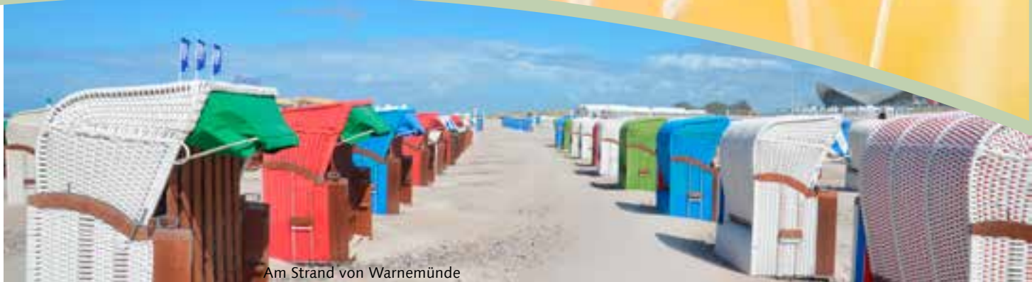
Am Strand von Warnemünde

Imposante Küsten in wahrer Vielgestalt: Strände schmal, steinig bis sandig weiß oder die vom Wind geformten Bäume! Eine wunderschöne Reise an der Meereskante entlang.