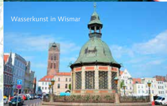
Wasserkunst in Wismar