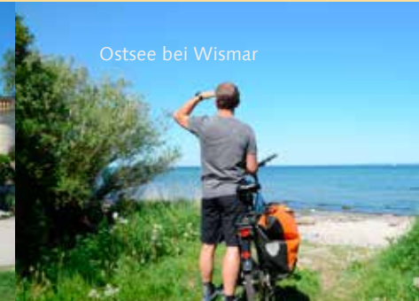
Ostsee bei Wismar