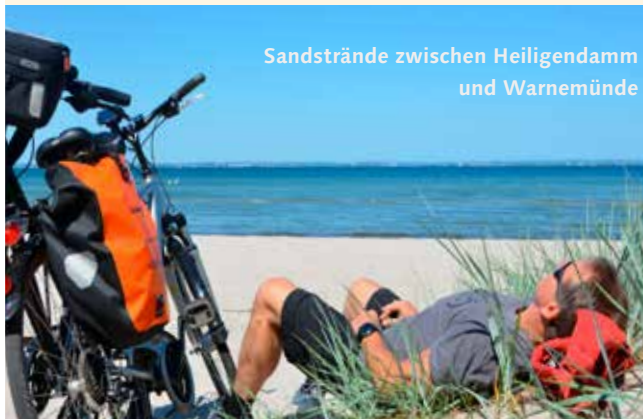
Sandstrände zwischen Heiligendamm und Warnemünde