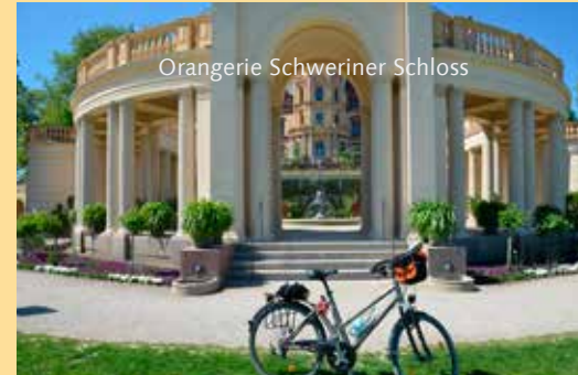
Orangerie Schweriner Schloss