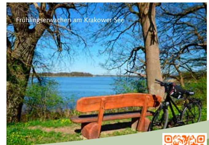
Frühlingserwachen am Krakower See

* Die Tickets sind im Reisepreis enthalten.