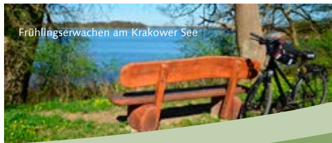
Frühlingserwachen am Krakower See