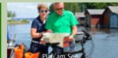
Plau am See

Saison 2023 „Mecklenburger Seentour“ Tourcode: Seen6 7 Tage/6 Übernachtungen