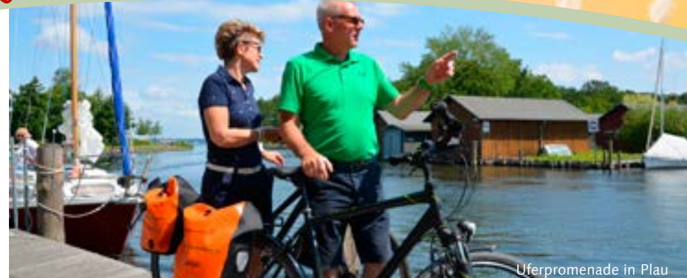
Uferpromenade in Plau

Empfehlung: Legen Sie in Krakow einen Tag zum Paddeln über die insel- und buchtenreichen Seen ein! Wenn Sie in Groß Breesen Ihr Quartier haben (Kat.2), dann können Sie für kleines Geld den Transfer zum See dazubuchen. (Kat. 1 benötigt keinen Transfer.)