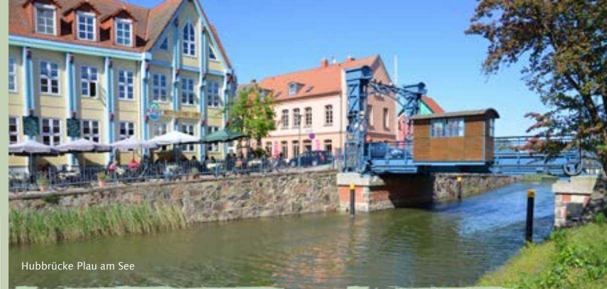
Hubbrücke Plau am See