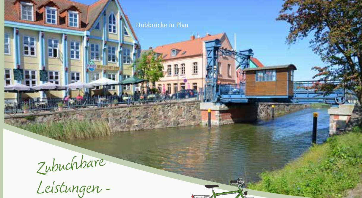
Hubbrücke in Plau