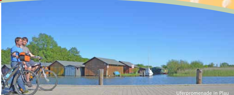
Uferpromenade in Plau

Vom Plauer See geht es über die Krakower Seen und die Müritz bis hin zur Kleinseenplatte. Schöne Paddelreviere gibt es hier, probieren Sie es einfach mal aus!